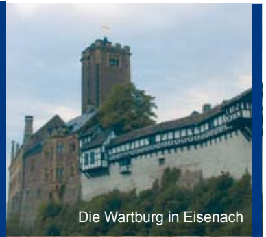
Die Wartburg in Eisenach

... FRAGT NACH DEN WEGEN DER VORZEIT ... JEREMIA 6,16