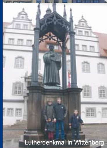
Lutherdenkmal in Wittenberg