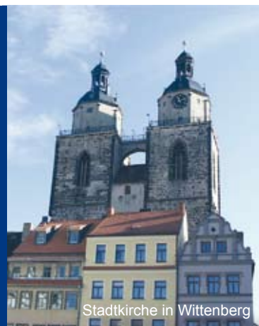
Stadtkirche in Wittenberg