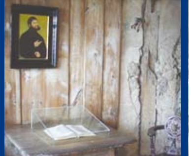
Die Lutherstube auf der Wartburg