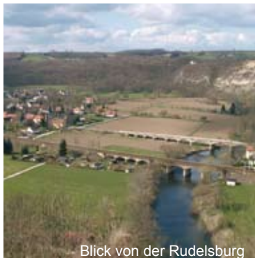
Blick von der Rudelsburg