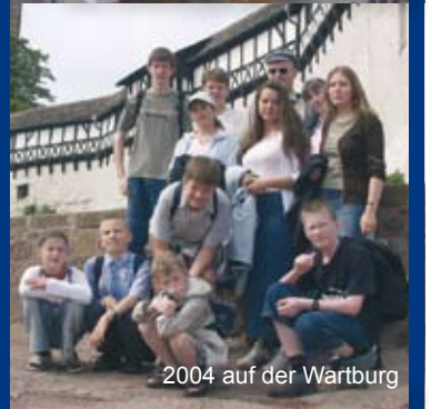
2004 auf der Wartburg