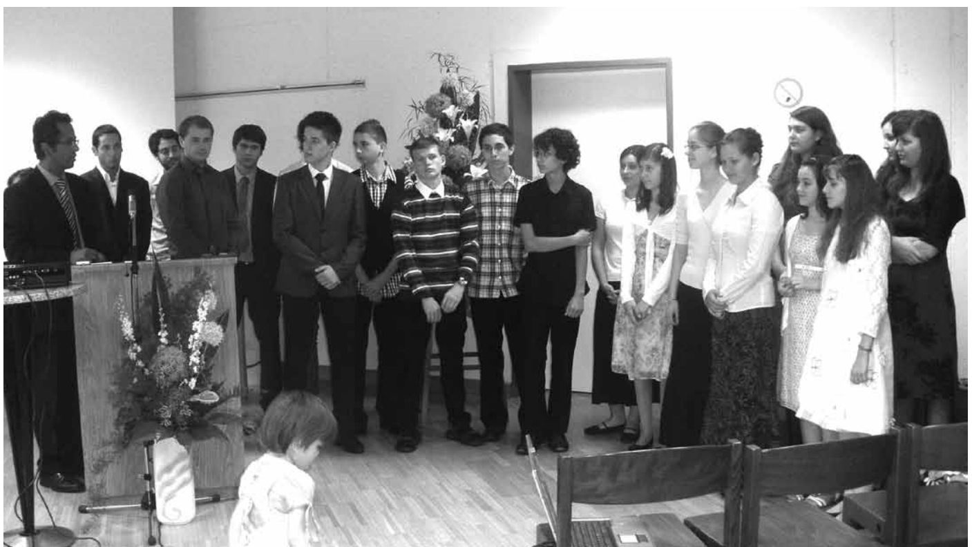
Konferenz in Österreich 2011, Aufruf an die Jugend

Bist du bereit dein Bestes für den Meister zu geben? Bist Du bereit, alles, was möglich ist, für Einigkeit und Frieden zu tun? Möge die Einheit des Geistes Dich in Deinem Heim und in Deiner Gemeinde segnen. Möge sein Geist Deine Familie dazu inspirieren, zuhause und in Deiner Ortsgemeinde zu dienen und Missionsarbeit und Freundlichkeit zu praktizieren. Amen